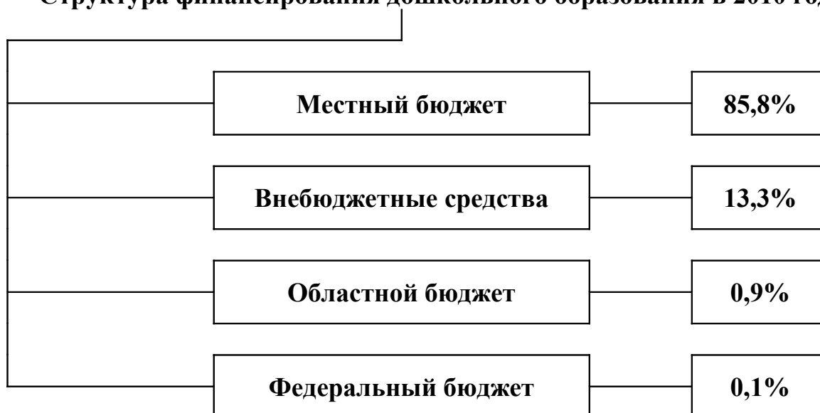
Схема № 2