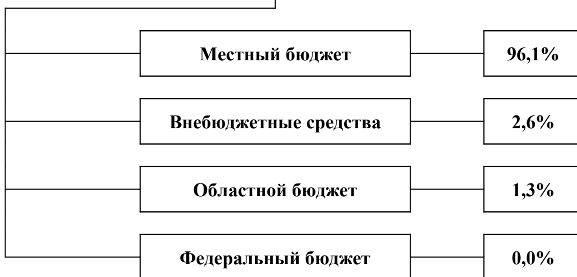
Диаграмма № 1